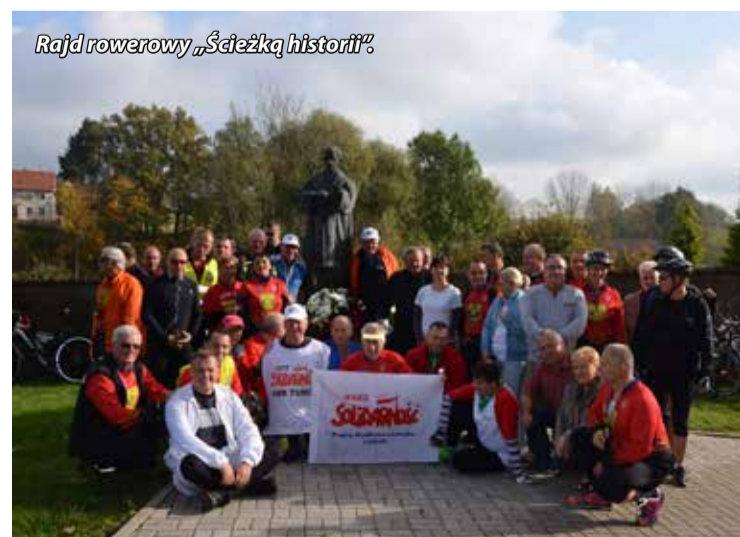
Rajd rowerowy „Ścieżką historii”