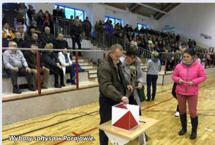
Wybory sołtysa w Porajowie.

lutego br. Nowi Sołtysi zostali wybrani w: Bratkowie, Działoszynie, Jasnej Górze, Porajowie, Sieniawce oraz Wyszko-