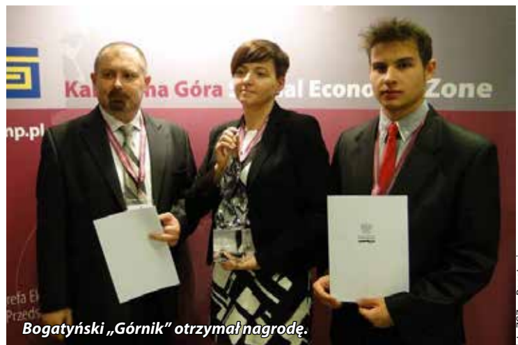
Bogatyński „Górnik” otrzymał nagrodę.

Zespół Szkół Zawodowych im. św. Barbary jest członkiem klastra edukacyjnego działającego przy Specjalnej Strefie Ekonomicznej Małej Przedsiębiorczości w Kamiennej Górze.