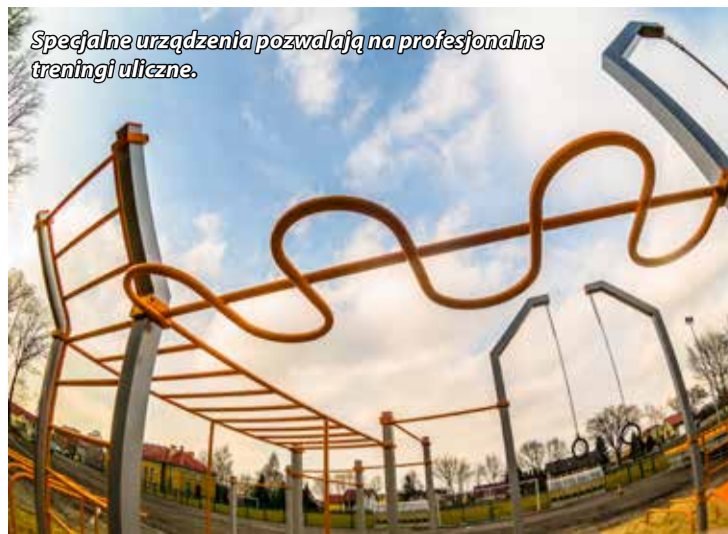
Specjalne urządzenia pozwalają na profesjonalne treningi uliczne.

Na profesjonalnie zbudowanych obiektach mogą szlifować swoje umiejętności zarówno zaawansowani pasjonaci, jak i początkujący amatorzy. Obiekt jest bezpłatny i dostępny dla wszystkich zainteresowanych.