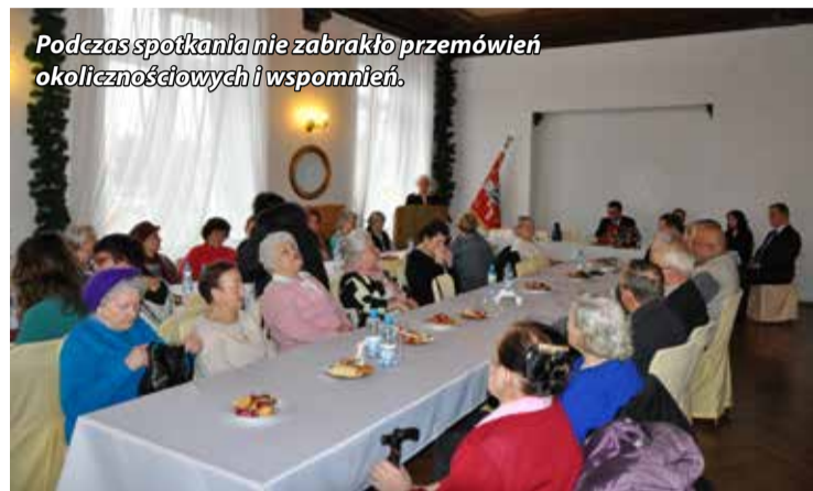
Podczas spotkania nie zabrakło przemówień okolicznościowych i wspomnień.