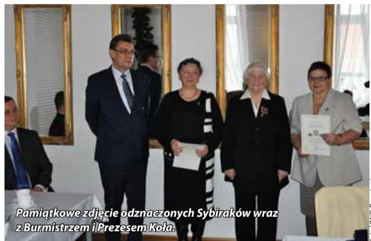
Pamiątkowe zdjęcie odznaczonych Sybiraków wraz z Burmistrzem i Prezesem Koła.