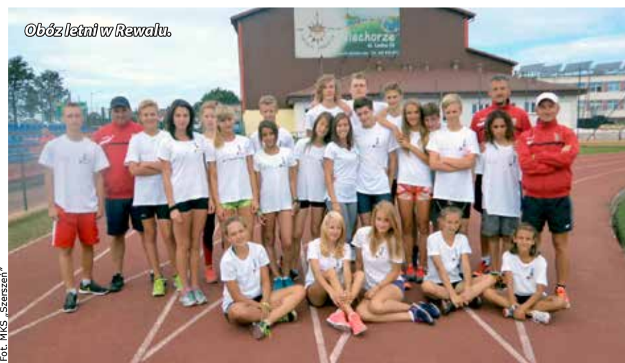
Obóz letni w Rewalu.