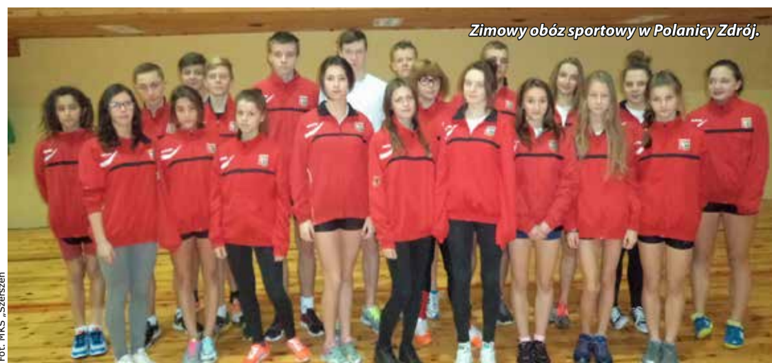
Zimowy obóz sportowy w Polanicy Zdrój.

Dziękuję za rozmowę, życząc dalszych sukcesów.