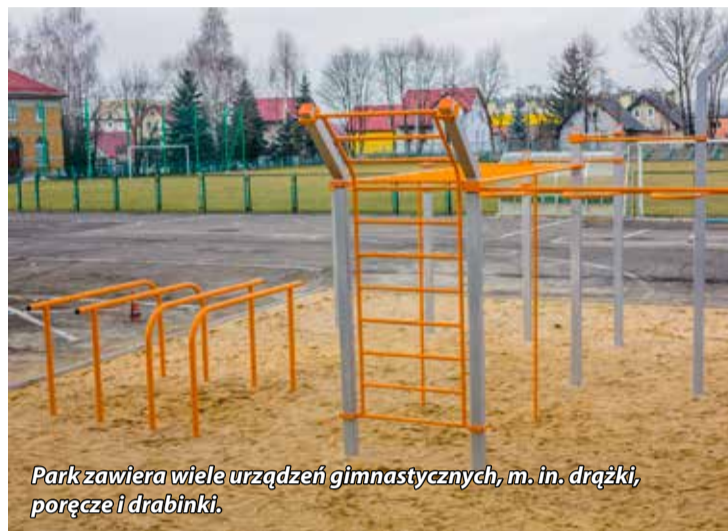
Park zawiera wiele urządzeń gimnastycznych, m.in. drążki, poręcze i drabinki.

Prawie 3 mln na odbudowę zniszczeń powodziowych