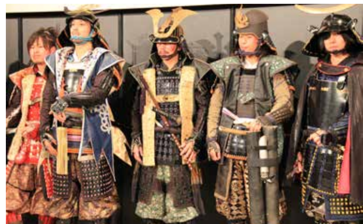
Fot. Henryk Dumin