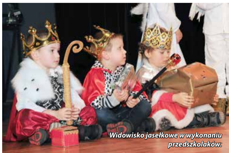
Widowisko jasełkowe w wykonaniu przedszkolaków.

glądu, dlatego też występy nie podlegały ocenie jury. Każdy z uczestników przeglądu, oprócz miłej zabawy, otrzymał słodki upominek, a przedstawiciele przedszkoli oraz oddziałów przedszkolnych odebrali w imieniu placówki pamiątkowy dyplom i statuetkę. Do zobaczenia za rok!