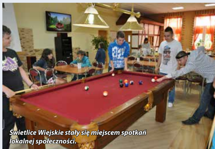
Świetlice Wiejskie stały się miejscem spotkań lokalnej społeczności.