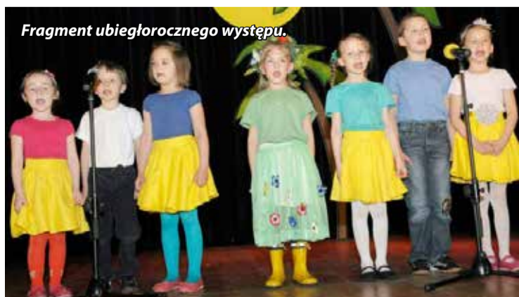
Fragment ubiegłorocznego występu.

cego repertuaru wzruszają publiczność i wywołują uśmiech na twarzy widzów niezmiennie od wielu lat. Festiwal będzie miał charakter przeglądu, dlatego też dzieci i ich występy nie będą poddawane ocenie jurorów. Serdecznie zapraszamy na spotkanie z najmłodszymi śpiewającymi artystami. Wstęp wolny.