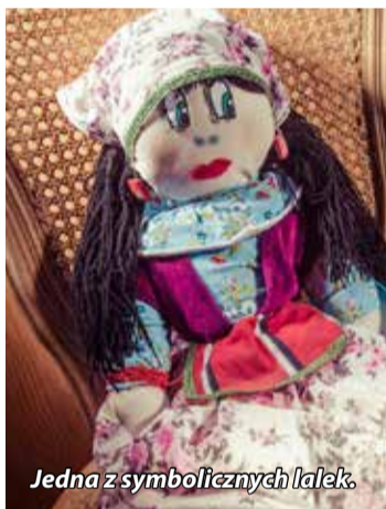
Jedna z symbolicznych lalek.